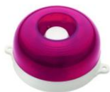
МАЯК-12-КП, МАЯК-24-КП оповещатель комбинированный