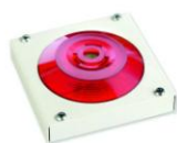
МАЯК-220-КПМ1-НИ оповещатель комбинированный, металлический корпус, наружное исполнение